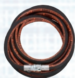
Crijevo za mort PFT RONDO 25mm, 10m