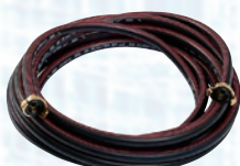
Crijevo za vodu/zrak 1/2", 11m sa GEKA