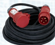
Produžni kabel 5x4mm 2 , CRVENI 5-32A – 25m