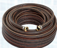
Crijevo za vodu/zrak 3/4", 40m sa GEKA