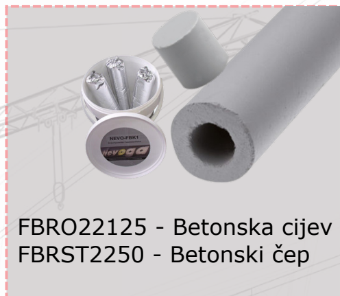
FBRO22125 - Betonska cijev FBRST2250 - Betonski čep