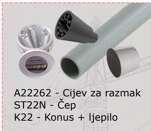
A22262 - Cijev za razmak ST22N - Čep K22 - Konus + ljepilo